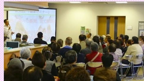
新薬とジェネリック医薬品の違い

漢方薬の話題では風邪や腹痛などの症状ごとに適した漢方薬の使い方を紹介し、「風邪のときは漢方薬を飲んでみよう」、「漢方薬に興味があった」と大きな関心をもっていただけました。今後もセミナーで健康長寿のためになる話題を取り上げますので、当院の患者さんも地域の方もご参加ください。